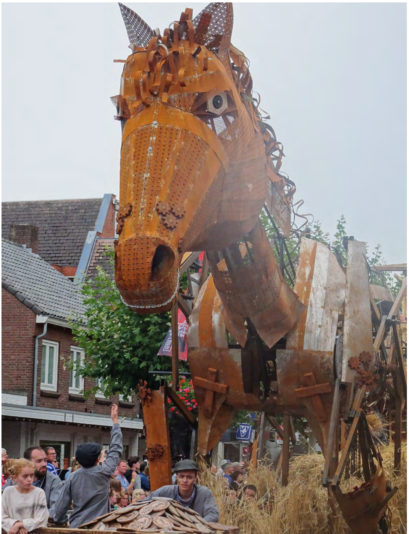
Graphisch ontwerp: Ontwerphaven

KENNISCENTRUM IMMATERIEEL ERFGOED NEDERLAND