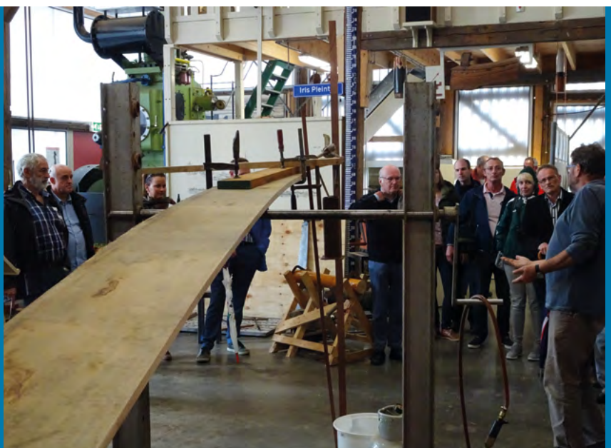
Tijdens de Zeeuwse informatiedag op 24 september in Zierikzee werden demonstraties ambachtelijke scheepsbouw verzorgd op de Stads- en Commerciwerf.