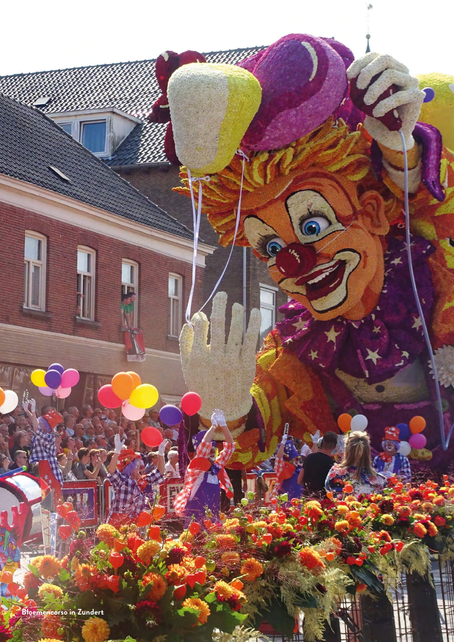
Bloemencorso in Zundert